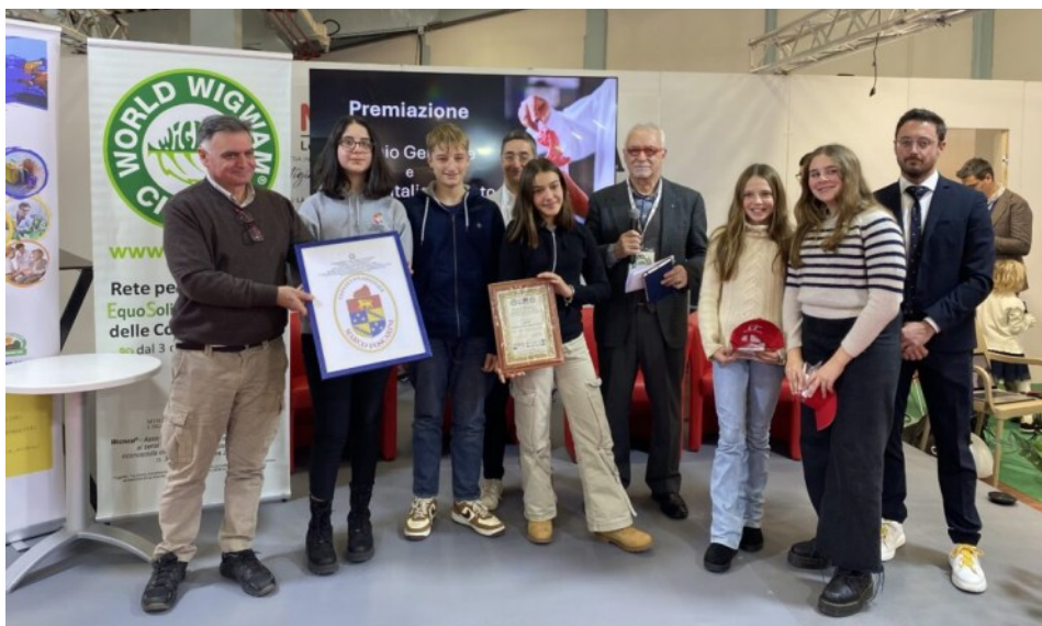
Edizione 2024 - I giovani comunicatori premiati alla Fiera MIG di Longarone (BI)