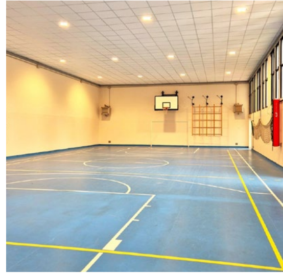
► La nuova palestra della scuola Moroni

Costo complessivo dell'intervento circa 210.000€.