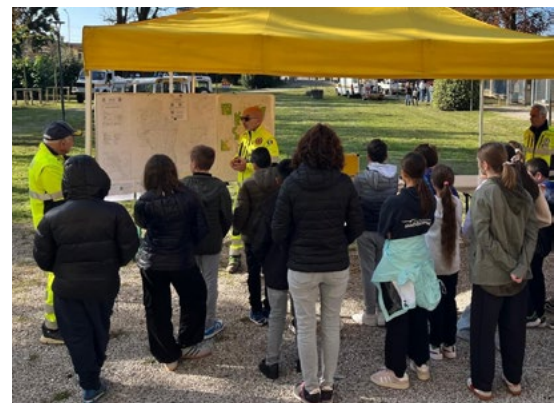
► Incontro tra la Protezione Civile e le prime classi della scuola secondaria di primo grado Moroni presso il parco di Villa Zusto

Il giorno 7 ottobre una delegazione del gruppo comunale di Protezione Civile , con il supporto di alcuni volontari del distretto Padova Nord Est , ha incontrato presso il parco di Villa Zusto, le prime classi della scuola secondaria di primo grado Moroni. Lo scopo è stato quello di sensibilizzare i giovani all'impegno sociale e alla conoscenza del territorio e sue problematiche oltre alla descrizione delle funzioni ed attività svolte dalla Protezione Civile Comunale. Si ringraziano i volontari di Protezione Civile ed i ragazzi che hanno dimostrato partecipazione, attenzione, curiosità ed interesse.