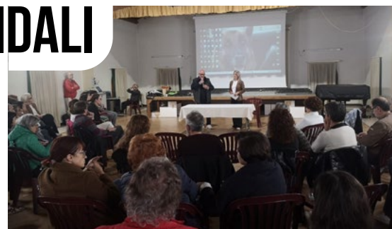
► Incontro sul tema delle aspettative nell'accoglienza presso la parrocchia con i volontari delle Famiglie in Rete

continua a crescere, coinvolgendo un numero sempre maggiore di famiglie volontarie pronte ad affiancare minori e nuclei in situazioni di difficoltà temporanea. L'iniziativa, promossa dal Comune con l'Azienda ULSS e i servizi sociali, si fonda su un modello di solidarietà tra pari , in cui le famiglie offrono tempo, ascolto e supporto educativo, contribuendo a creare legami di comunità autentici e duraturi. La Rete di Vigodarzere conta circa 30 volontari e segue una decina di bambini , consolidando una buona pratica di prossimità sociale, capace di atti-