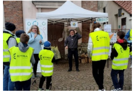
► "Domeniche Ecologiche", organizzate in collaborazione con l'Associazione Aiutiamoci a tenere pulito Vigodarzere