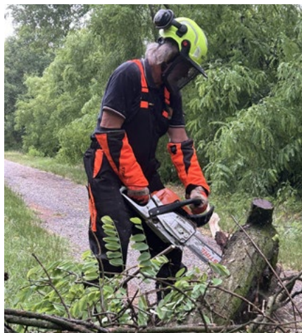
► Interventi di manutenzione lungo l'argine della Brenta

Il giorno giovedì 2 ottobre, la sede della Protezione Civile di Vigodarzere ha ospitato il secondo importante incontro con la Croce Rossa Italiana (CRI) . Questo appuntamento è stato utile per approfondire la reciproca conoscenza e condividere competenze. Lavorare insieme è necessario, per sviluppare procedure e sinergie efficaci che permettano di ottimizzare e massimizzare l'efficacia dei nostri interventi in caso di necessità e calamità. Un ringraziamento speciale a tutti i volontari di entrambe le organizzazioni per la passione ed il tempo dedicato alla formazione.