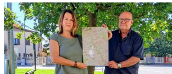
► Nuova mappa illustrativa della Ciclovia del Brenta

Composta da pratici fogli che si strappano, è disponibile nella sede del Municipio in piazza Bachelet, nella biblioteca di Villa Zusto, presso gli agriturismi e b&b locali e presto in numerosi esercizi commerciali.