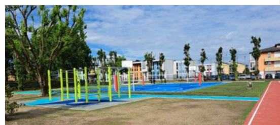
► Area sportiva comunale polivalente