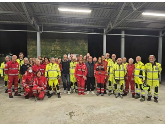
► Gruppo Comunale di Protezione Civile di Vigodarzere